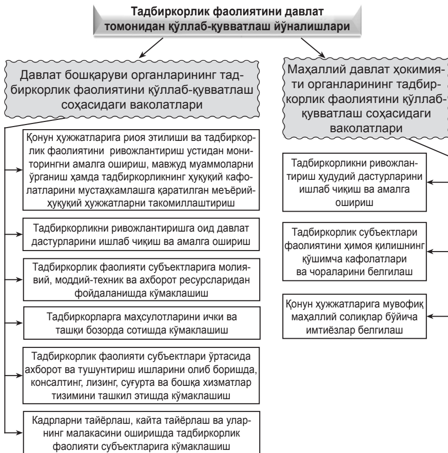
2.1.1-расм. Кичик тадбиркорлик фаолиятини давлат томонидан қўллаб-қувватлаш йўналишлари ва механизмлари. 1

Ўзбекистонда давлат бошқаруви органлари тадбиркорлик фаолияти субъектларини ҳар тарафлама қўллаб-қувватлаш чораларини кўради (2.1.1-расм).