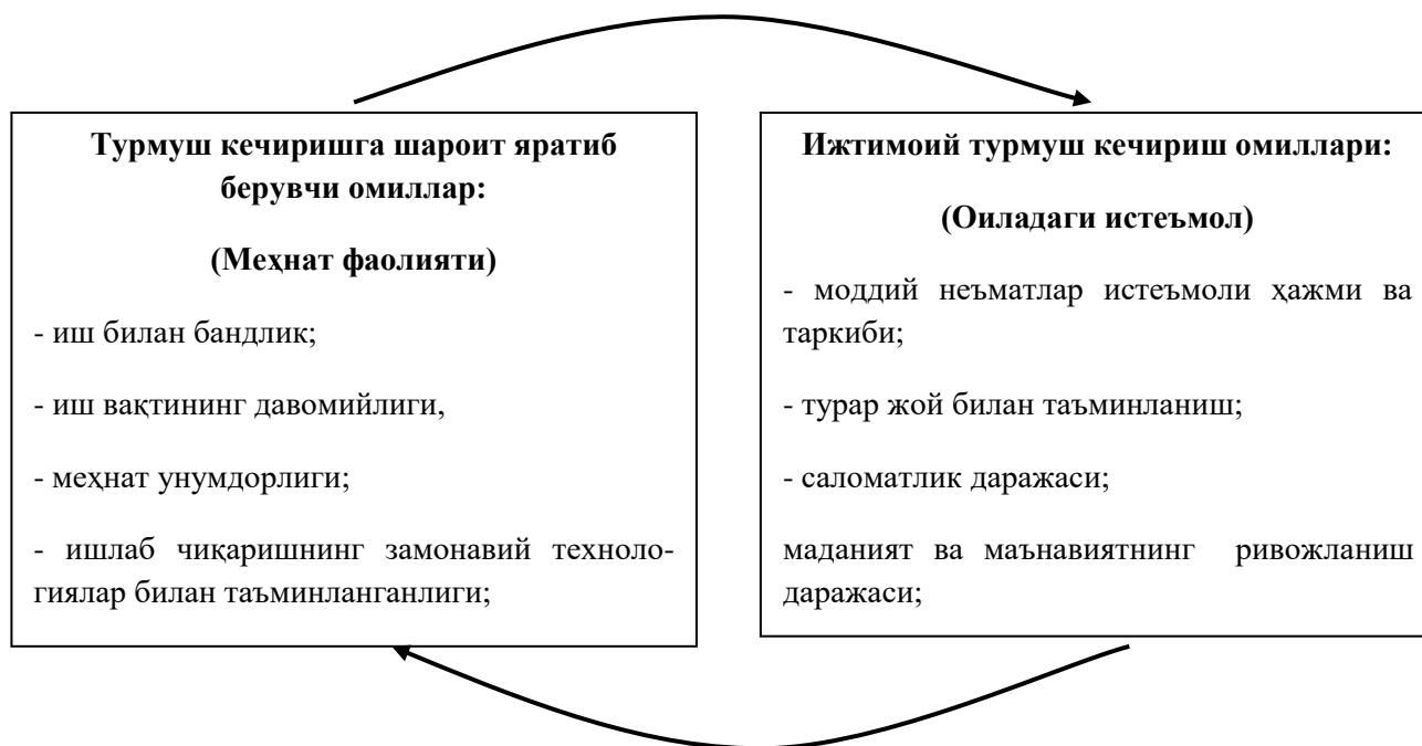
1–расм. Саноат соҳасида оилавий тадбиркорлик ривожланиши билан ишловчилар-нинг уй ҳўжаликларидаги омилларини ўзаро боғланиши 1 .

Саноат соҳасида тадбиркорликни ривожлантиришнинг асосий йўналишларидан бири оилавий тадбиркорликни йўлга қўйиш ҳисобланади. Оилавий тадбиркорлик йўлга қўйилиши саноатдаги меҳнат жараёнларининг мазмуни ўзгаришига олиб келади. Саноат соҳасидаги оилавий тадбиркорликда иш вақти аниқ белгилаб берилмайди, оила аъзолари куннинг исталган вақтида ишлаши ёки дам олиши мумкин. Оилавий бизнесда ишловчилар сони чегараси ёки оиладаги ишловчилар ёшини белгилаб бўлмайди. Саноат соҳасида оилавий бизнес ривожланиши билан иш ҳақининг мазмуни ҳам ўзгаради. Оилавий бизнесда фаолият юритувчилар ойлик маош олмасдан, оиланинг умумий даромадидан фойдаланади. Шунингдек, оилавий бизнес саноатни ривожлантириш учун аҳолининг бўш пул маблағларини жалб этишнинг муҳим омили ҳисобланади.