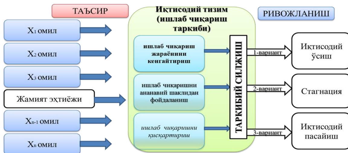
Расм 1. Таркибий ўзгаришларни амалга ошириш йўналишлари [8]

Таркибий ўзгаришларга ишлаб чиқариш жараёнини кенгайтириш орқали эришиш, ишлаб чиқариш ҳажмини кенгайтириш, ишлаб чиқариш жараёнига инновация, янги турдаги бошқарув усуллари қўллаш орқали рўй беради. Натижада мамлакат иқтисодиёти барқарор ўсишга эришади.