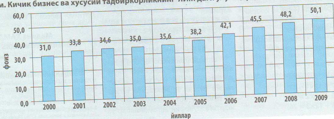
1-расм. Кичик бизнес ва хусусий тадбиркорликнинг ЯИМ даги улуши, фоизда