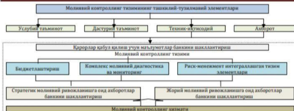
4-расм. Молиявий контроллинг хизматининг ташкилий модели