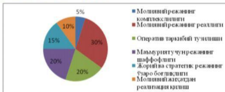
1-расм. Молиявий режалаштириш билан боғлиқ муаммолар

Демак, молиявий режалаштириш соҳасидаги муҳим муаммолардан бири тезкор молиявий режалаштириш тизимини реал шарт-шароитларга асосланган ҳолда шакллантириш амалиёти билан изоҳлаш мумкин. Ҳақиқатан ҳам акциядорлик жамиятлари ўзига хос мураккаб микроиқтисодий тизимни ифодалаб, молиявий менежментни самарали ташкил қилиш, унга юклатилган миссиянинг ижроси йиллик ёки кварталлик молиявий режалаштириш тизимига боғлиқ. Молиявий режа яқин ва истиқболли прогноз кўрсаткичларининг реал имкониятларга асосланган ҳолда шакллантирилганлиги, ундаги вазифалар корхона ички имкониятлари билан бирга ташқи муҳит шарт-шароитларидан келиб чиқишига боғлиқ.