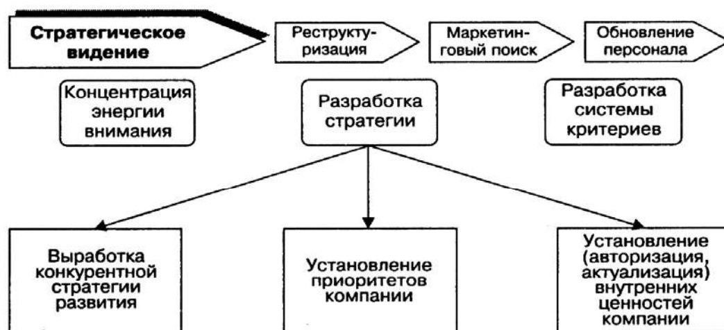
Рис. 1. «Дорожная карта» развития отрасли.

Для совершенствования маркетинговой стратегии мы предлагаем следующую модель, который предоставит возможность разработать более четкую, «Дорожную карту» развития отрасли.