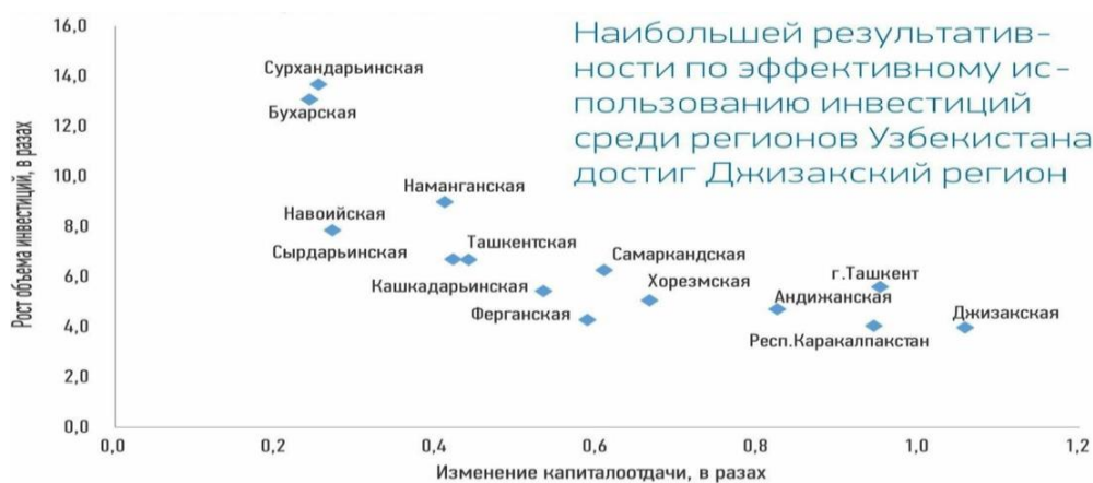
Рисунок 1 – Рост инвестиций и изменение капиталотодачи в регионах за 2000-2018 годы (в размах, в сопоставимых ценах 2000 года) 8

Как видно из анализа коэффициента производительности капитала в экономике регионов Узбекистана (рис. 1), наибольший объем инвестиций за 2000-2018 годы был привлечен в экономику Сурхандарьинской области [3]. Объем привлеченных инвестиций к 2018 году увеличился в 13,7 раза по сравнению с 2000 годом. Однако следует отметить, что данный регион имеет самые низкие значения по эффективности капитала: изменение капиталотодачи к 2018 году составило 0,25 раза по сравнению с уровнем 2000 года.