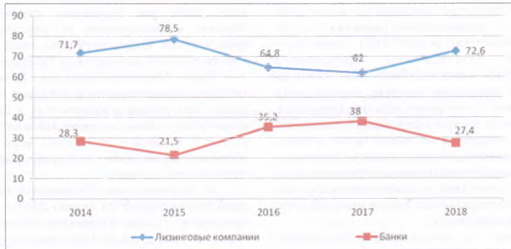
Рис. 2. Доля "игроков" на лизинговом рынке

Тенденция роста объемов новых лизинговых сделок распределена среди «игроков» на рынке лизинга следующим образом (рис.2)