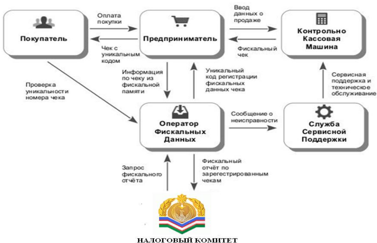
Рис.2. Механизм информационного обмена контрольно кассовых машин в «on-line» режиме

основным инструментом функционирования теневой экономики. Соответственно противодействие теневой экономике должно обеспечивать информационную безопасность фискальных данных. Одним из ключевых средств противодействия этим угрозам является организация передачи фискальных данных в режиме «онлайн» от продавца в налоговые органы на примере рисунка №2. Этому способствует рост технической оснащённости предпринимателей средствами фискального контроля, а также широкий охват сетью телекоммуникаций.